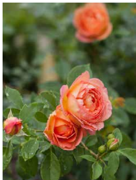
Rožių žiedų spalvos visame sode preciziškai suderintos: labai ryškios raudonos ar geltonos nėra, tačiau šalia terasos įrengtame rožyne spalvos sodresnės, toliau nuo namo esančiuose gėlėse žydi švelnesniais, pasteliniiais – rausvų, oranžinių, baltų, persikų atspalvių žiedais. Pati gražiausia Gintarėi 'Lady of Shalott' veislės rožė – vos prasiskleidę žiedai yra persikų spalvos, vėliau jie tampa skaisčiai balti.